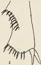
Abb. 2. Spitze der Hinterschienen bei Clysterius guineensis n. sp.

Vorderschienen mit drei Außenzähnen, Vordertarsen beim Männchen mäßig stark verdickt, die innere Klaue viel stärker als die äußere, hakenartig gekrümmt und an der Spitze fein gespalten. Prosternalzapfen freiliegend, hoch. Spitze der Mittel- und Hinterschienen breit und stumpf dreieckig gezackt und gezähntelt, mit starken Endborsten und mit zwei Endspornen (Abb. 2). Mittel- und Hinterfüße einfach, kaum länger als die ent-